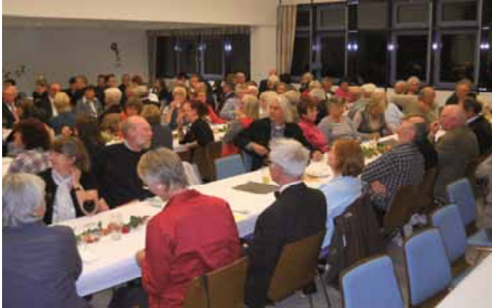
Gut besuchtes Michelbacher Bürgerhaus

Mit einem kurzweiligen Programm im Bürgerhaus Michelbach feierte der Männergesangverein „Einigkeit“ Michelbach e.V. sein bewährtes Federweiserfest, das sich schon