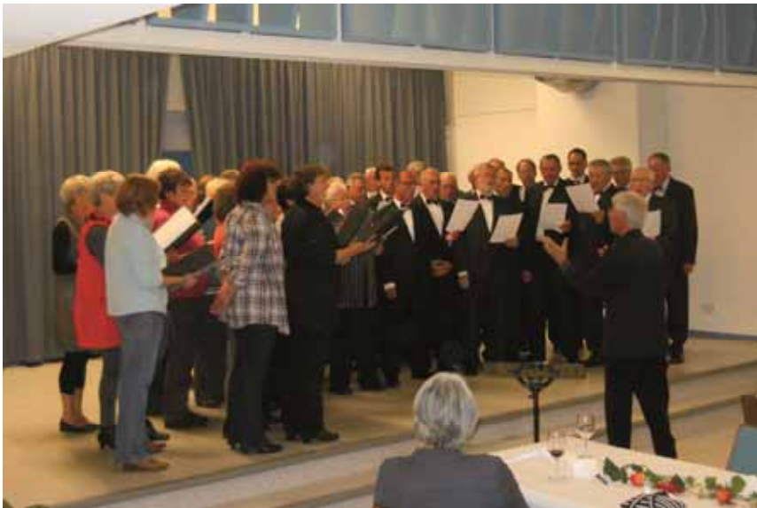
MGV Einigkeit und Singkreis als Gemeinschaftschor

Haben Sie als in Michelbach wohnender Mann Lust am Singen? Und sei es auch nur unter der Dusche?