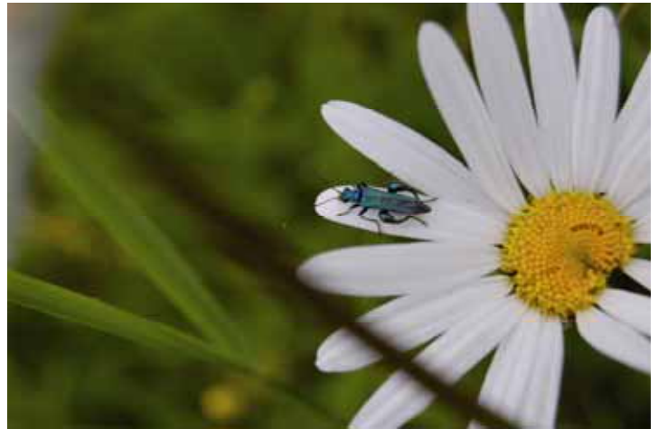
Grüner Scheinbockkäfer auf Wiesenmargerite"

Einheimische Pflanzen haben den zusätzlichen Vorteil, dass sie an unser Klima und unsere Bodenverhältnisse angepasst